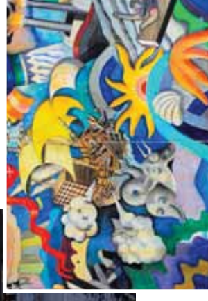
Wandfließ an Bord des Traditionsschiffes